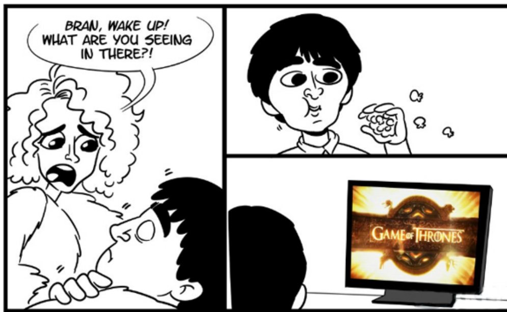
Fig. 3:

dark words es una de las frases más repetidas de la saga (al punto de que algún usuario de Reddit también la denuesta). Los árboles acumulan información que es accesible directamente mediante la conciencia. Luego, esto deja de ser posible y solo quedan los libros como expansores artificiales del punto de vista.